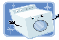
Máquina de Lavar