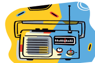
Aparelho de Som