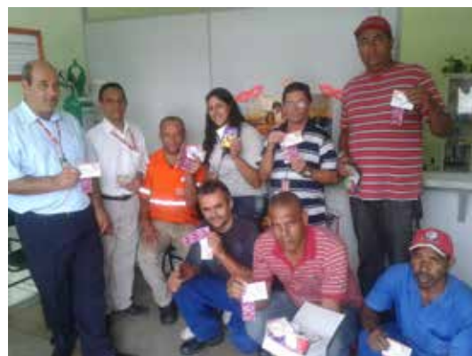
Unidade M'Boi Mirim