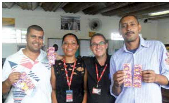
Unidade A.E. Carvalho