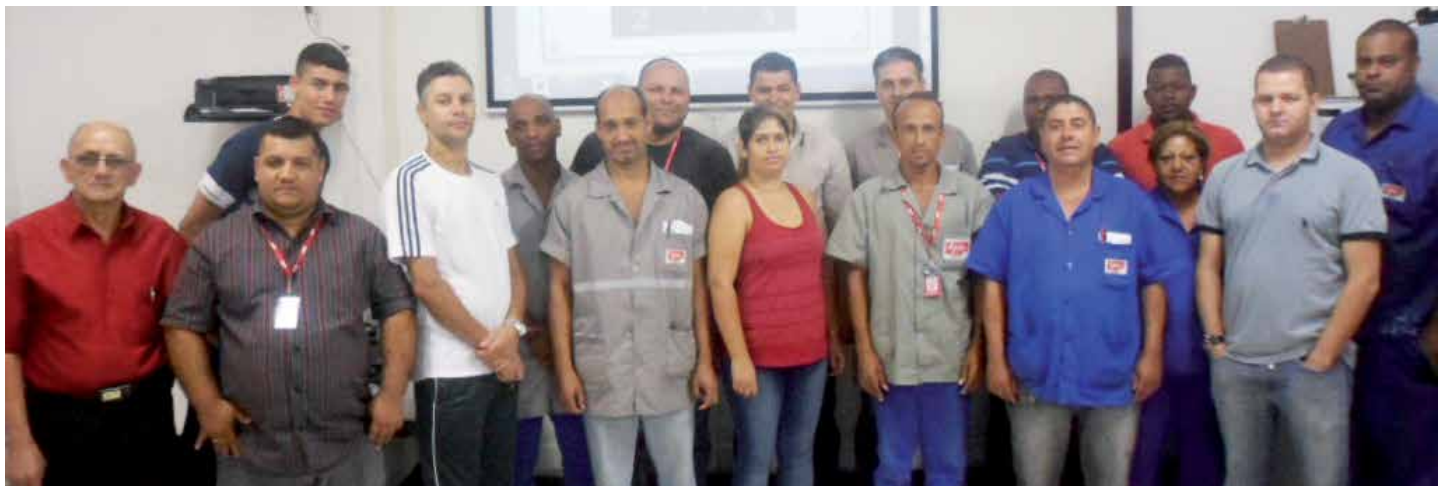
Grças ao trabalho da equipe da Manutenção, o Grupo VIP foi reconhecido mais uma vez pela SPTrans