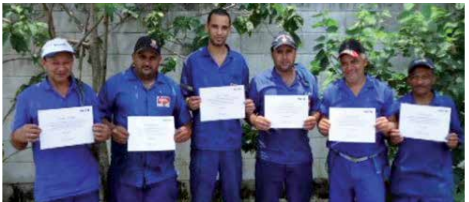
Cada vez mais preparados, os participantes mostram seus certificados