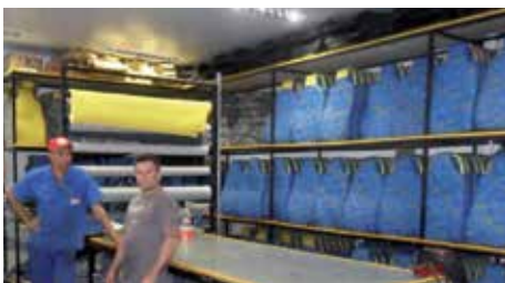
Novo setor de Tapeçaria: ótimas condições

Em janeiro foi inaugurado o novo setor da Tapeçaria, na unidade M'Boi Mirim. Com espaço amplo, o local ficou muito adequado, proporcionando condições de trabalho ainda melhores aos colaboradores.