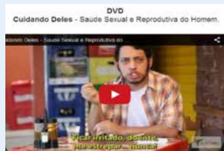
DVD “Cuidando Deles”: muitas dicas e informações para sua saúde

http://www.barong.org.br/projetos_saudedohomem_2.html