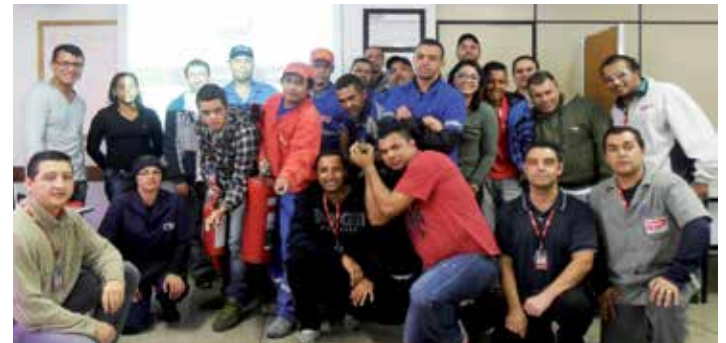
Unidade M'Boi Mirim