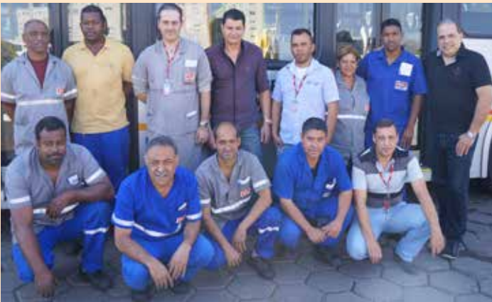
Trabalho em equipe foi primordial para a Certificação pelo segundo semestre consecutivo. Representando toda a equipe de manutenção, alguns deles posam para a foto felizes com a conquista