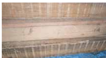
Unidade M'Boi Mirim: almoxarifado, rampas, manutenção preventiva e pranchão