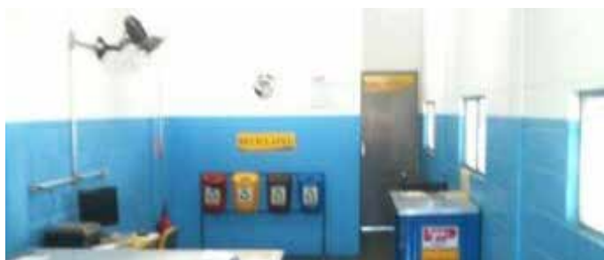
Unidade Itaim: elétrica

A avaliação do projeto SOL (5S), feita no final de junho, mostrou que a mudança de atitude dos colaboradores é uma realidade. Nota-se que as equipes estão envolvidas nesse espírito de melhoria contínua, seguindo os conceitos básicos organização, arrumação, limpeza, padronização e disciplina. Os resultados são melhorias ligadas ao bem-estar no ambiente de trabalho, segurança e otimização das atividades. O Grupo VIP parabeniza todos os colaboradores que contribuíram para esse resultado. Veja alguns destaques positivos.