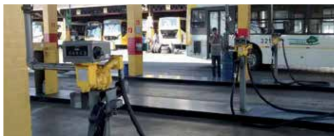
Unidade A.E. Carvalho: lavador (acima) e posto de combustível