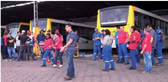
Unidade A.E. Carvalho