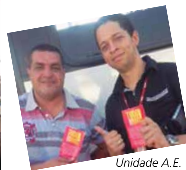
Unidade A.E. Carvalho