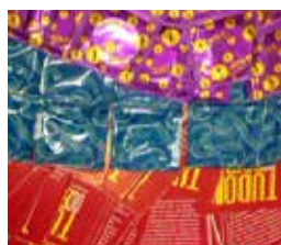
Distribuição de preservativos e folhetos informativos a toda a equipe