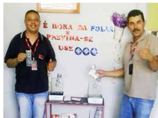
Unidade M'Boi Mirim