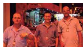
Colaboradores capacitados trabalhando no Noturno