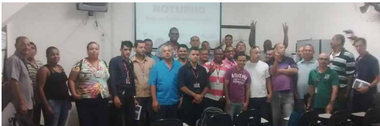
Equipe preparada para atender clientes da nova modalidade de transporte: o Noturno

Desde o dia 28 de fevereiro o Grupo VIP está operando com um grande número de linhas na Rede de Ônibus da Madrugada, chamada de Noturno. O serviço funciona da meia-noite às 4h e atende milhares de pessoas que dependem de transporte noturno para ir para suas casas.